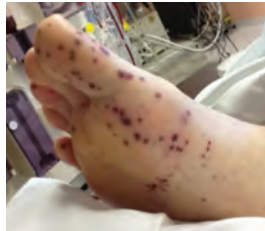
Abordagem ao Síndrome Pulmão-Rim